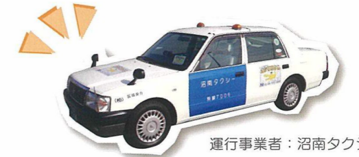
運行事業者：沼南タクシー

運行日：月曜日から土曜日 (日曜祝日と12月29日～1月3日は運休) 運行時間：午前8時30分から午後7時まで